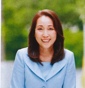
自民党戸塚区連合支部女性局長

がなですが、触れ合った多くの方も非常にアグレッシブでイキイキした方ばかりでした。なかでも社会で活躍する女性の多さには本当に驚きました。この4月には「第12回アフリカンフェスティバルよこはま2019」が横浜赤レンガ倉庫で開かれます。アフリカへの理解を深める良い機会だと思うので、ぜひ足を運んでみてはいかがでしょうか。