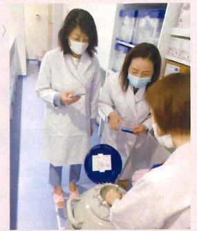
↑みなとみらいゆめクリニックに視察時に、卵子の凍結保存について説明を受けました。がん治療をされる方が完治をされた後、体外受精での出産を目指します。

「よこはま自民党」では子どもが欲しいと願い不妊治療に取り組む人への支援として、保険適用の拡大や仕事と治療の両立が支援を可能にする環境整備の必要性を訴えてきました。第1回定例会議(2月9日)では「市職員の不妊治療に関わる現状」「職員が安心して出生支援休暇を活用できるための方策」「特定不妊治療費助成申請の件数増加」について質問しました。厚生労働省の調査では治療と仕事の両立ができていないと答えた人は約5割、職場との共有を「一切していない」と約6割の人が回答しました。この結果は市職員の中にも該当者がいるのでは、と懸念を抱きます。また現状、特定不妊治療は社会保険適用外で全額自己負担です。費用負担の軽減を図る目的で市は助成金を支給、さらに党の政策により2021年1月からは助成対象の所得制限を撤廃、支援の拡充を図りました。現在、令和4年度からの保険適用について議論が進められています。しかし保険適用の狭間で支援が行き届かないということがないように、また助成制度の撤廃などがないよう要望しました。