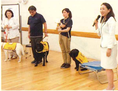
↑当日は補助犬3頭も来てくれました

2002年の「身体障害者補助犬法」の施行により、公共施設や飲食店などの民間施設でも補助犬の同伴の受け入れが義務付けられました。にもかかわらず、今も社会的偏見は根強く残っています。また療養中の子どもたちや認知症や自閉症などの障害を持つ人を支える「ファシリテイドッグ」の存在にも注目が集まっています。人のために働く犬たちの存在を、多くの方に知っていただき、社会の中で広く受け入れていって欲しいと思います。